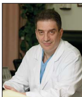
Курцер Марк Аркадьевич Главный акушер-гинеколог Департамента здравоохранения г. Москвы, член-корреспондент РАМН, профессор